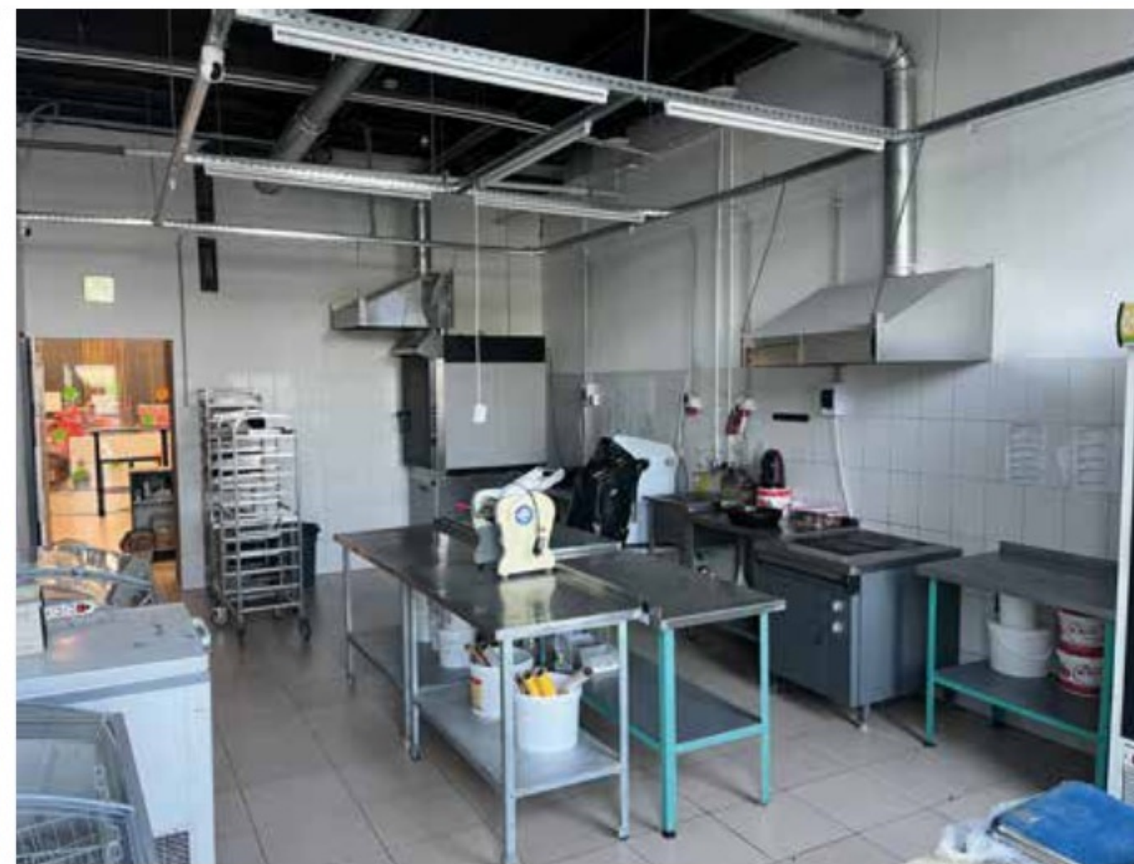
Пекарня на Сергея Есенина 1 Тверь