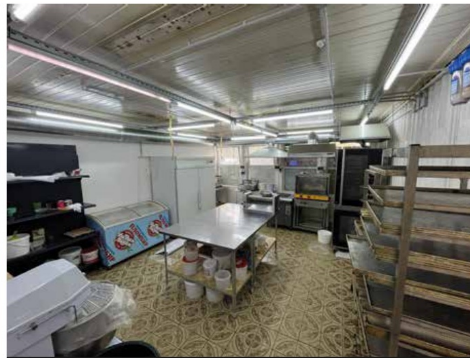
Пекарня на Туполева 124Б Тверь