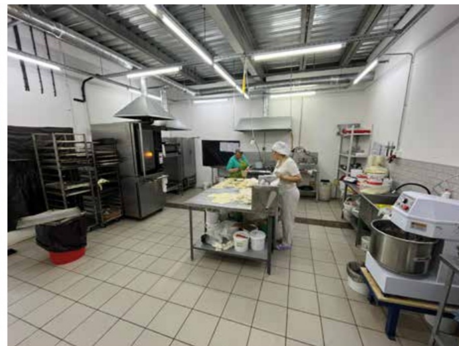
Пекарня на Можайского 61 Тверь