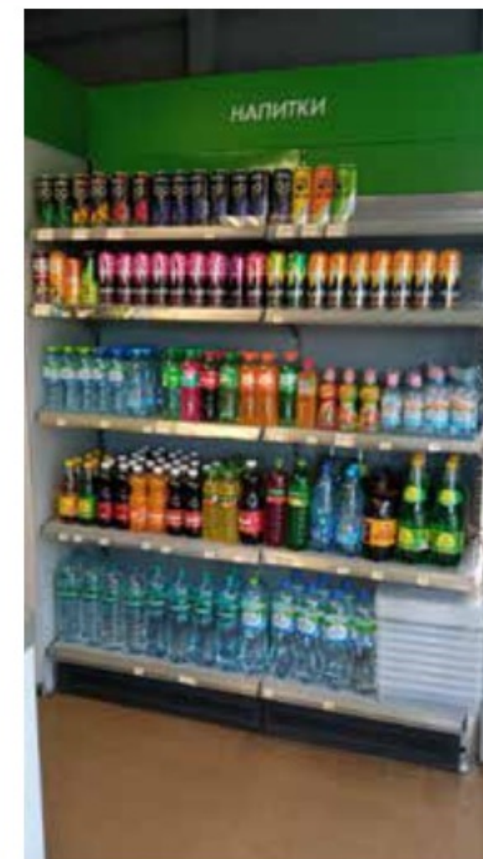
Павильон на Площади Гагарина 1 Тверь