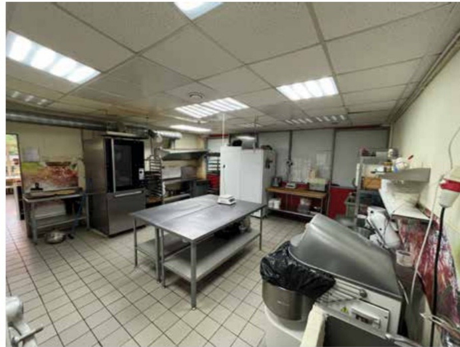
Пекарня на Карла Маркса 3 Тверь