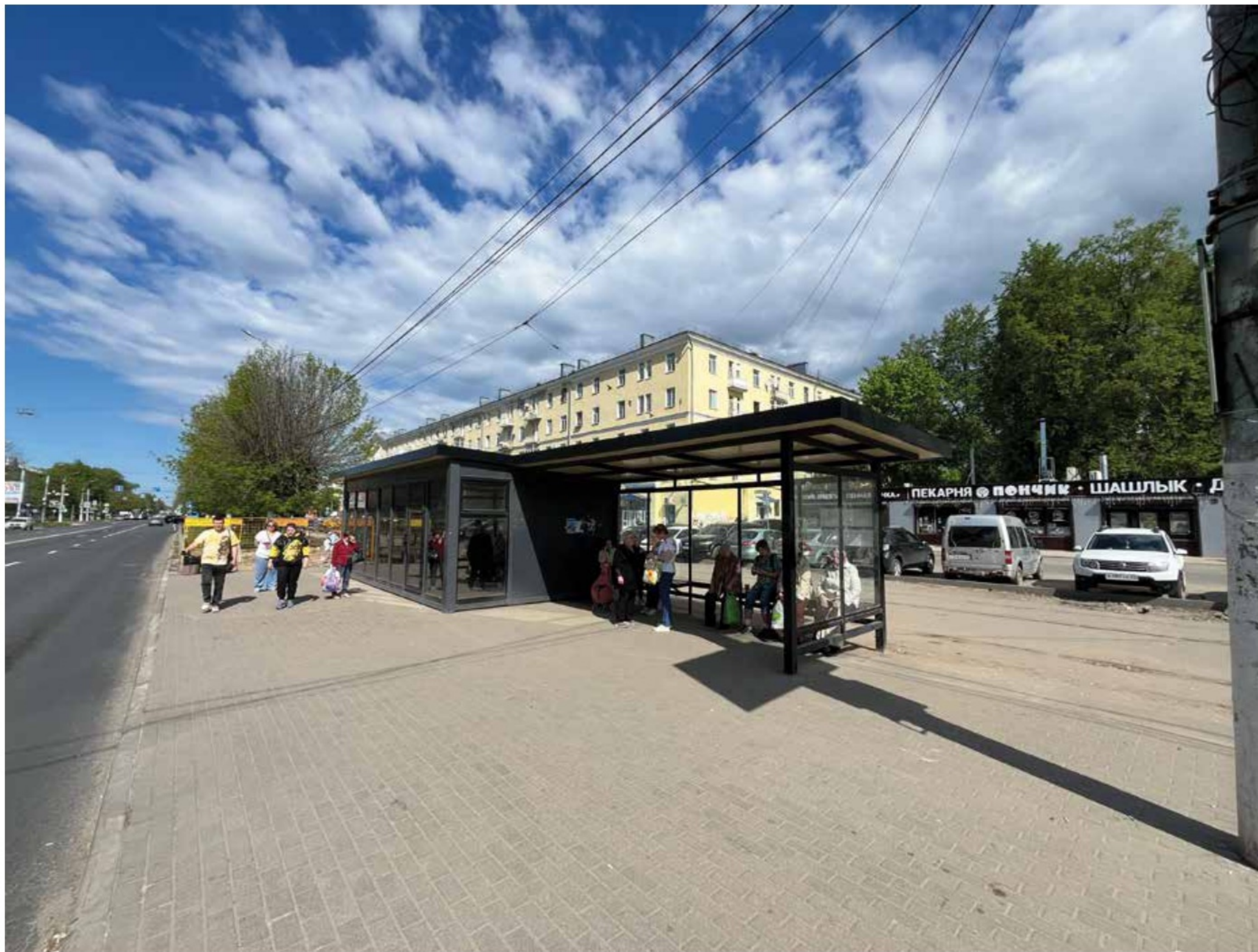
Павильон на Петербургском шоссе, 46 Тверь