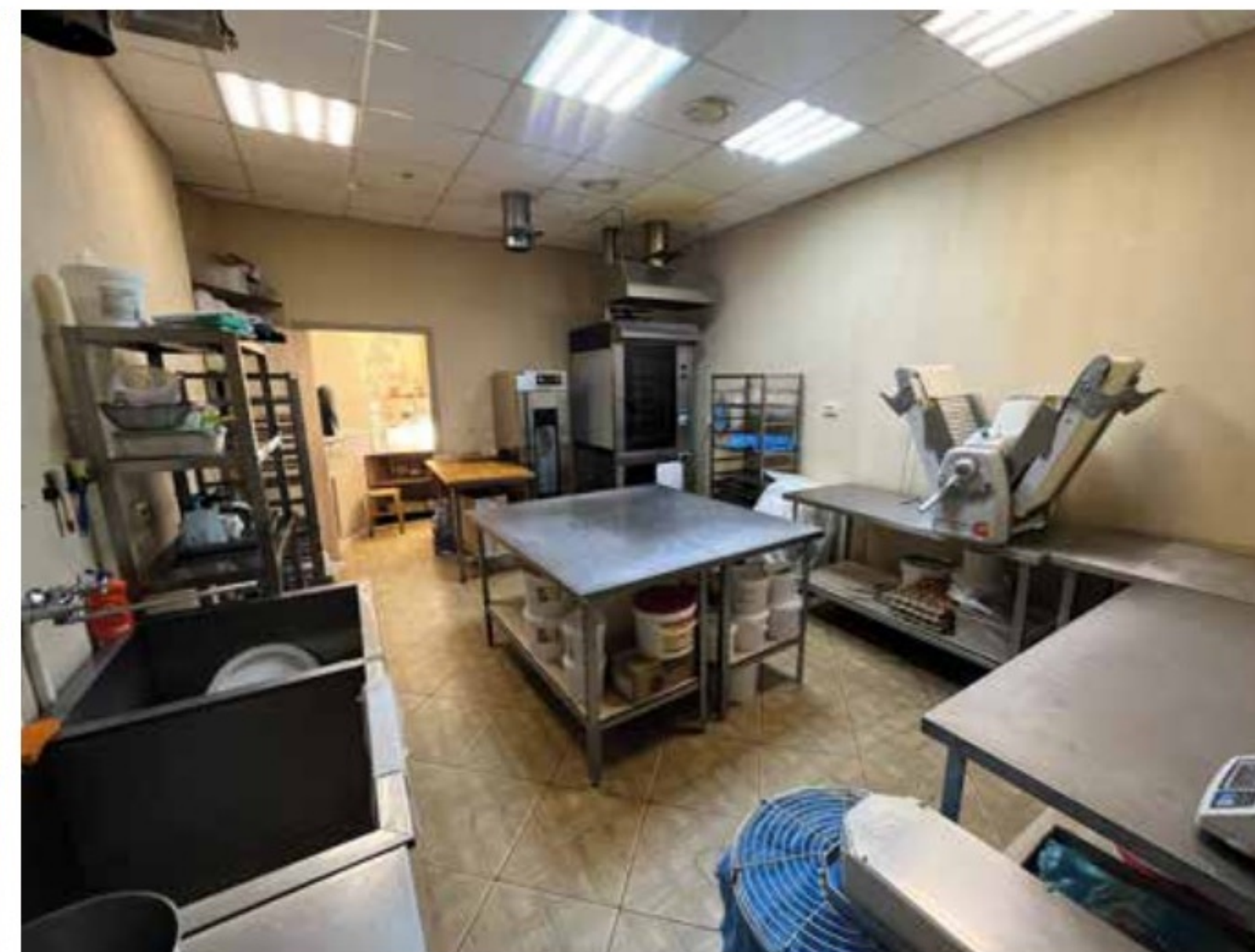
Пекарня на Красина 84 Тверь